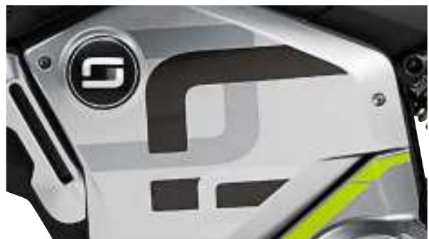
Matt-Silber/Grün (Limited Edition)